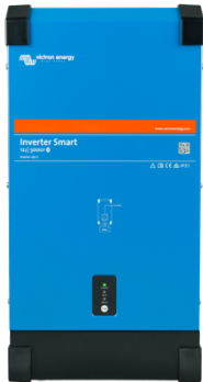
Inverter Smart 12/3000